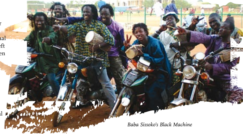
Baba Sissoko's Black Machine

De zeven andere muzikanten in Sissoko's Black Machine spelen allemaal tama. En net als hij zingen ze ook, en bespelen ze andere traditionele instrumenten als kalebas en ngoni. In de combinatie met Aka Moon zal dat echter geen traditionele Malinese muziek opleveren, noch pure jazz. 'Het moet een mix worden, een creatie tussen Afrika en Europa. Er zal jazz en traditionele muziek in zitten, maar ook nieuwe muziek die ik zelf geschreven heb', zegt Sissoko. 'De arrangementen doe ik samen met Fabrizio. We zijn als één familie aan het werk aan een nieuwe schepping. Hopelijk spreekt onze mix van jazz, Europese muziek, Malinese melodieën en Afrikaanse groove een nieuw publiek aan. In ieder geval zal het publiek muziek te horen krijgen die het nog nooit gehoord heeft.'